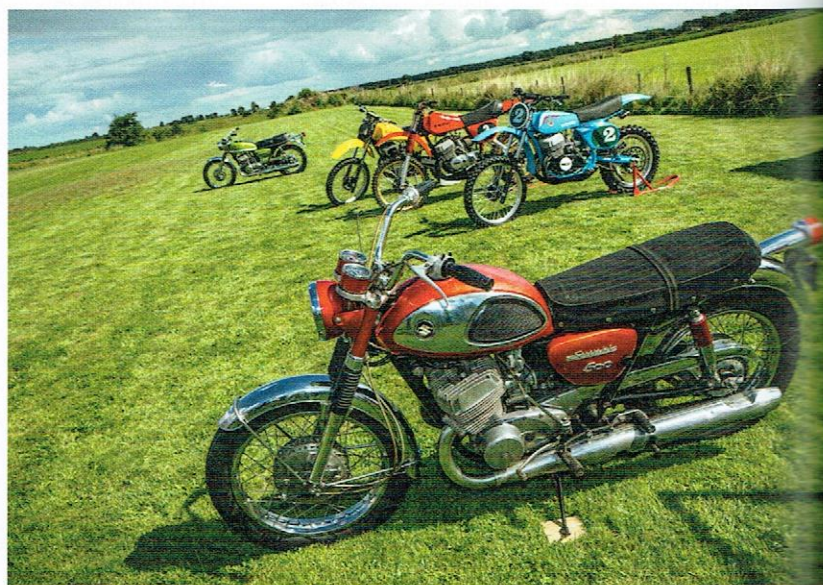
De Cobra - met z'n afgeronde tank en fluweel ogende buddy - is het eerste en meest begeerde T500-model. Helaas zijn ze... nogal prijzig.